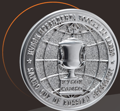
Спортивная медаль «Кубок Самбо»