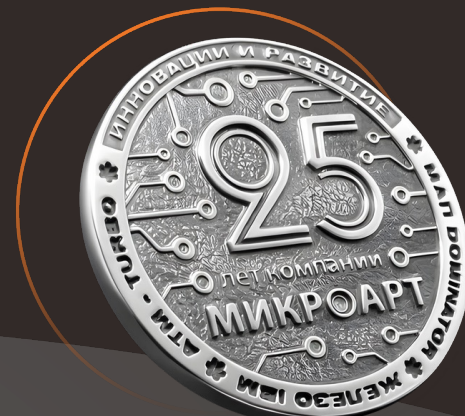
Юбилейная медаль «25 лет МИКРОАРТ»