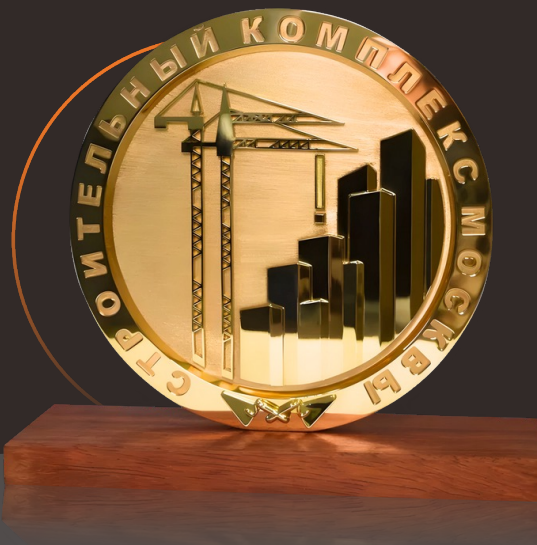
Настольная медаль «Строительный комплекс Москвы»