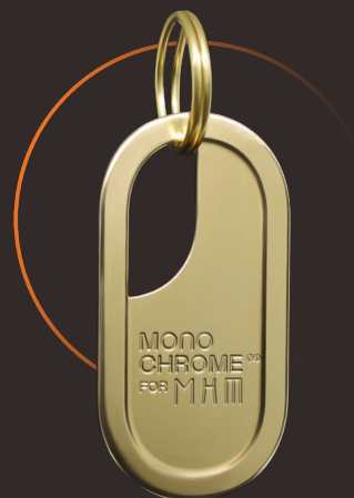
Брелок monochrome for MXT