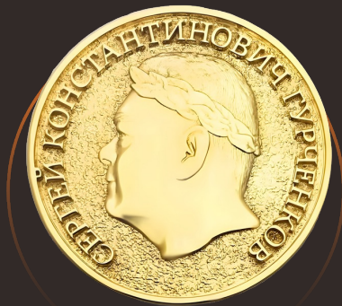
Медали и монеты