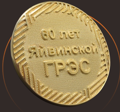
Значок «60 лет Яйвинской ГРЭС»